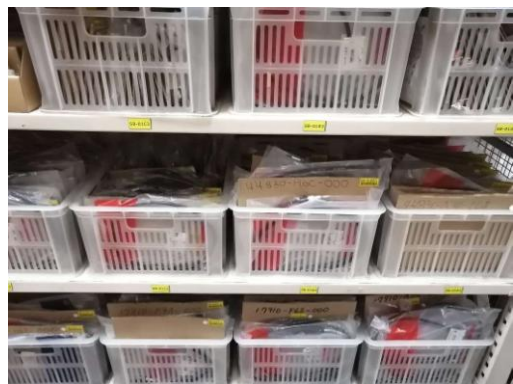
充実した部品在庫と管理システム